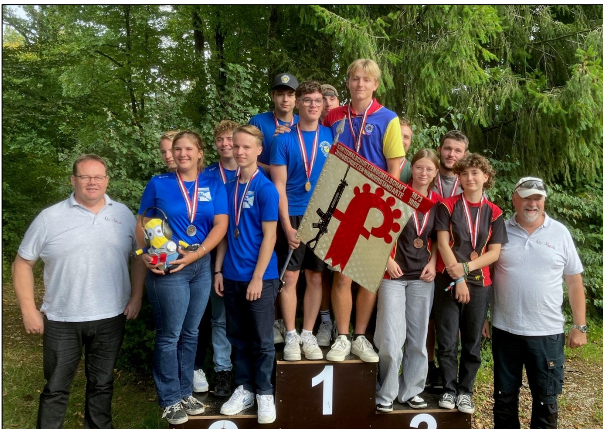
Die Gruppe I der SG Ziefen am Verbandsfinal, neben den Gruppen aus Pffeffingen und Hemmiken.