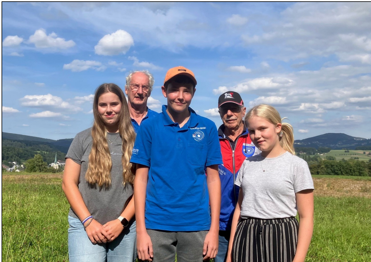
Die Gruppe der FS Bennwil mit ihren beiden JJ-Leitern am Verbandsfinal.