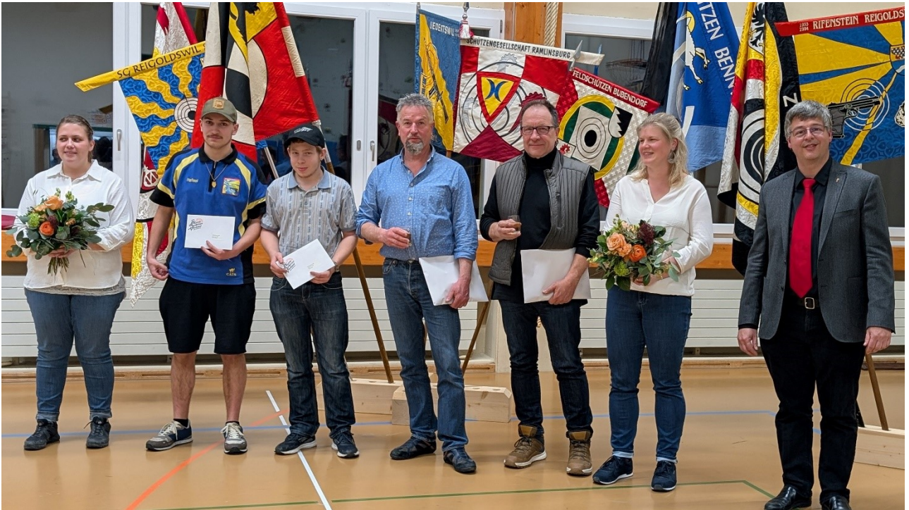
Gewinner Feldschieszen 2025