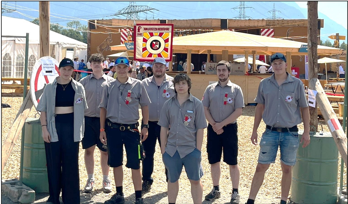
Die Gruppe des SV Niederdorf-Lampenberg mit ihren beiden JS-Leitern am ESFJ 2025.